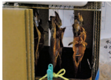
優秀賞「岩魚の燻製」