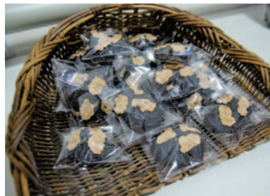
最優秀賞「炭クッキー」